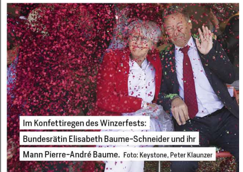
Im Konfettiregen des Winzerfests: Bundsrätin Elisabeth Baume-Schneider und ihr Mann Pierre-André Baume.

Nr. 213934, online seit: 25. September – 08.00 Uhr