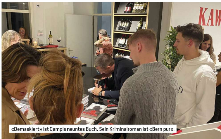
«Demaskiert» ist Campis neuntes Buch. Sein Kriminalroman ist «Bern pur».