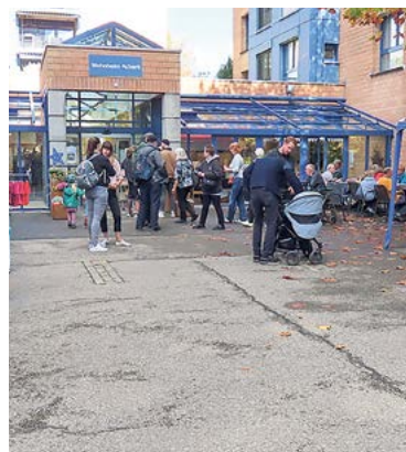
Gäste besuchen den Markt.